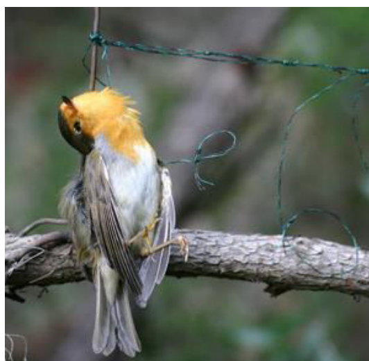
Fig. 3 - Lacci utilizzati in Sardegna per la cattura illecita dei tordi.