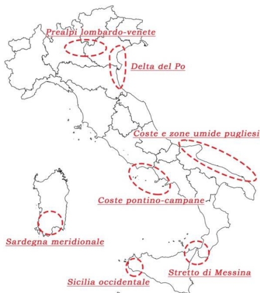
Fig. 7 - I black-spot dove le attività illecite nei confronti degli uccelli sono più intense.

I risultati delle indagini effettuate nel corso degli anni hanno permesso di mettere in luce come i reati contro gli uccelli selvatici non avvengano con la stessa frequenza sull'intero territorio nazionale. In alcune aree il fenomeno risulta particolarmente intenso; queste aree vengono definite black-spot secondo una terminologia riconosciuta a livello internazionale. In Italia è possibile individuare almeno sette black-spot : le Prealpi lombardo-venete, il Delta del Po, le coste pontino-campane, le coste e zone umide pugliesi, la Sardegna meridionale, la Sicilia occidentale e lo Stretto di Messina (Fig. 7). A queste zone “calde” se ne aggiungono altre dove il prelievo illecito di uccelli selvatici, pur non essendo intenso come nei black-spot , appare comunque più frequente che nelle restanti parti del territorio. Tra queste ne compaiono alcune contraddistinte da elevate densità di cacciatori (come la Liguria, la fascia costiera della Toscana, la Romagna, le Marche) o caratterizzate dalla presenza di pratiche venatorie tradizionali oggi non più consentite dalla normativa vigente (come il Friuli-Venezia Giulia e parte del Veneto, dove un tempo era diffusa l'uccellazione).